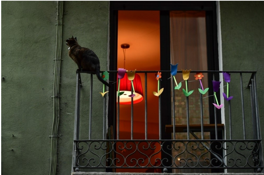
Pamplona'da bir balkon

Sadece Mudanjiang şehrindeki mega çiftlik, kuzeydoğu Çin'deki dev fabrika, ki oradaki yüz bin ineğin eti ve sütü Rusya pazarına gidiyor, Avrupa Birliği'ndeki büyükbaş hayvan çiftliklerinin en büyüğünün elli katı.