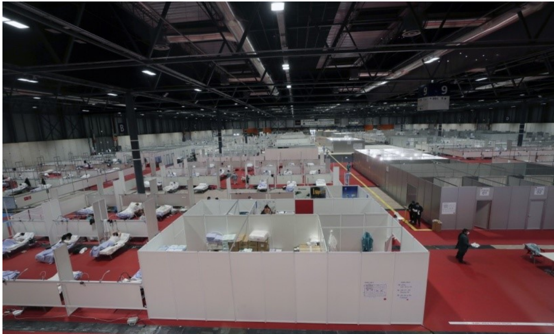
Madrid'de sahra hastanesi

Neoliberalizm ve onun siyasi aktörleri üzerimize bir mikroorganizmanın fırtınaya dönüştüğü sağanaklar yağdırdılar.