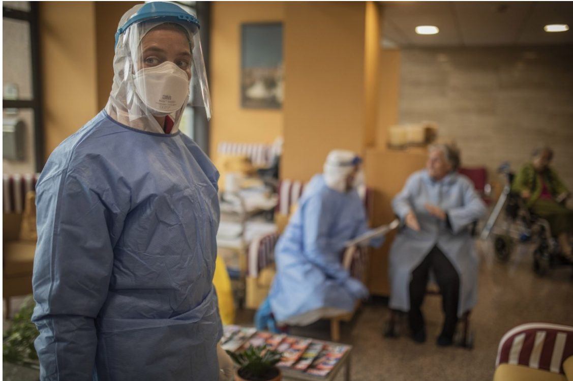
Barcelona'da Open Arms gönüllüleri Covid-19 testi yapıyorlar

2017 yılının Ocak ayında, Guangdong bölgesini tahrip eden domuz salgınının gelişmesinin ortasında Amerika Birleşik Devletleri'nden farklı viroloji araştırmacıları Virus Evolution adlı bilimsel dergide bir çalışma yayımladılar. Bu çalışmada dünyadaki koronavirüsün başlıca hayvan kaynağının yarasalar olduğunu işaret ediyorlardı.